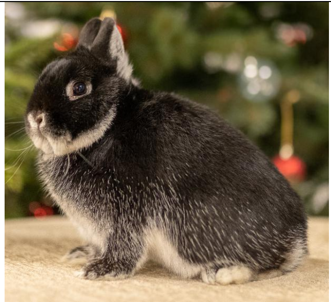
Käfig 210 Weisgrannen Schwarz 1-0 G23-521

Show A 97,5: Beste Tier andere Geschlecht Show C 194: Beste Tier andere Geschlecht