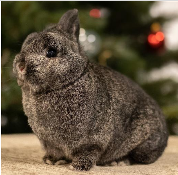
Käfig 43 Eisengrau 0-1 R213-121

7. Alle Winnaars van de ingezonden kleurslagen ontvangen een prachtige Rosette gedoneerd door Siwa Satyan